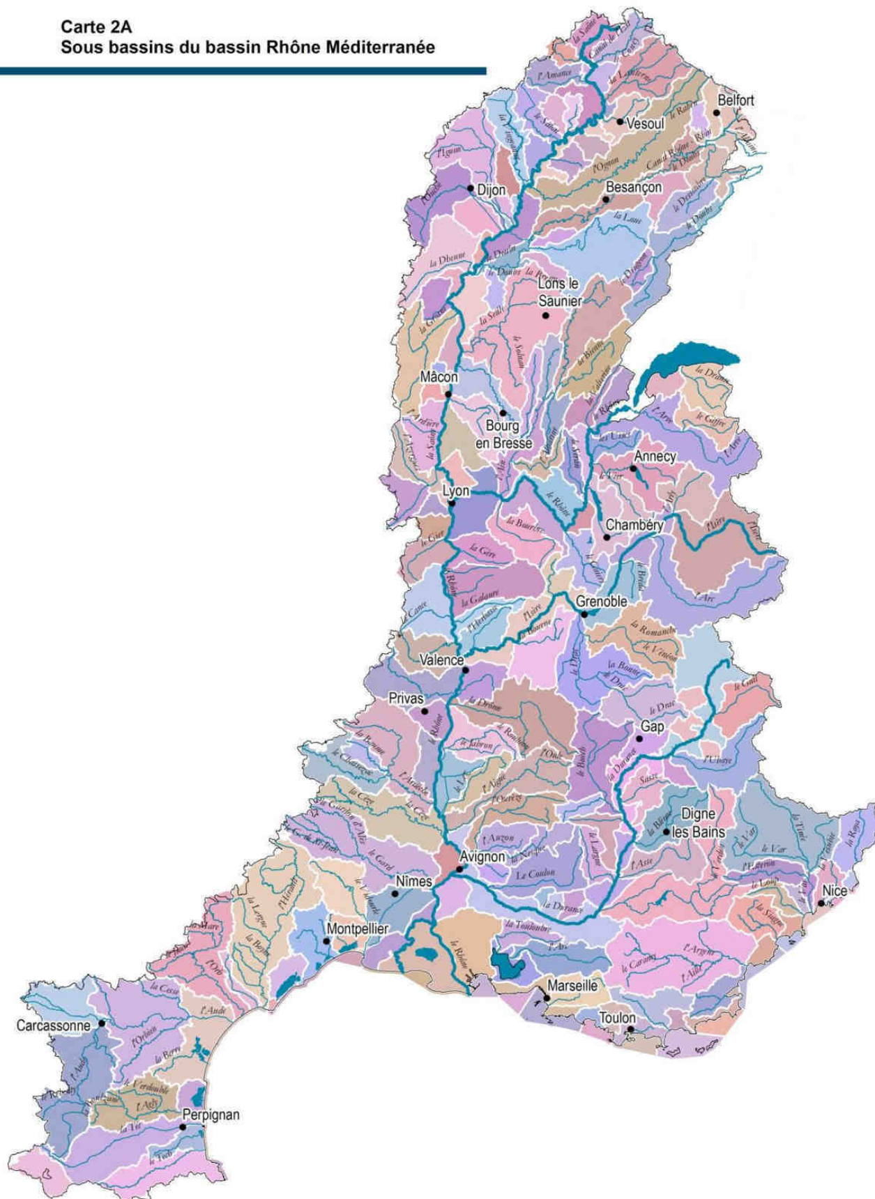
Carte 2A Sous bassins du bassin Rhône Méditerranée